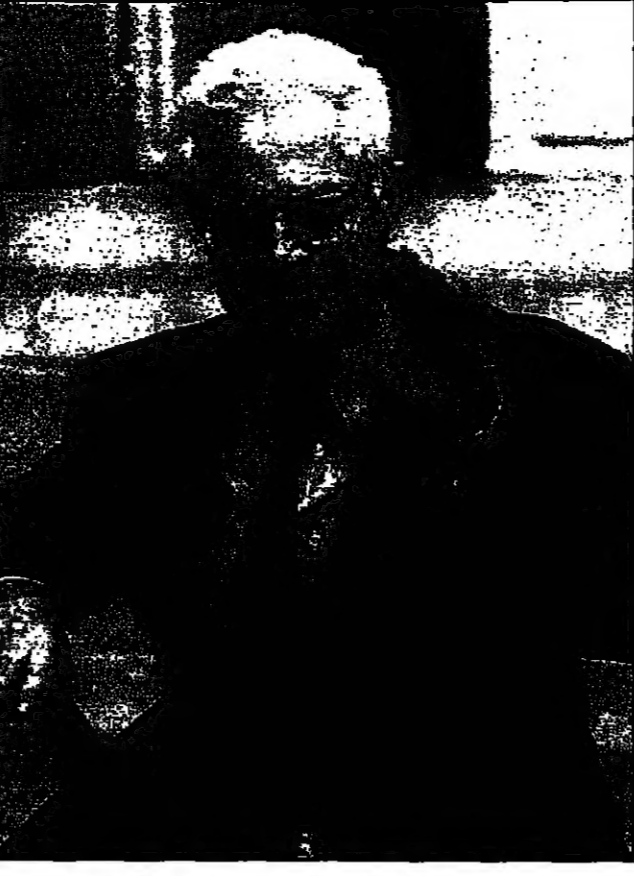
زعيم الحزب الاشتراكي الفرنسي ليويل جوسبان عقب تكليفه لمن تشكيل حكومة جديدة

الأحد الماضي أنزل الناخبون غلابا قاسيا واليمين وفي الدورة الثانية أصغروا الحكم النهائي: إنه القصاص، لقد زرع رئيس الجمهورية الريح وجسد العاصمة (-) أن اليمين يقع من الاستهتار للجحرف بمعاملة الفرنسيين، وللحرة الأولى في تاريخ الجمهورية الخامسة خلق الرئيس في حل الجمعية الوطنية. وخرج ضعيفا جدا من هذه العملية. واعتبر الآن يباريفيت في صحيفة طوفهاخروء لخبيرا أن الكارثة حلت مكان الانتفاضة للثقل، ماذا سيحصل الآن؟ بات اليمين يطرح أمام الناخبين، لكنه لا يكون شجاعا بل يخشاه في التعويض السابقين، والظلم القوي هذه المرة. الشياطين سيكون غير محتلم للتحرفين القاصيين.